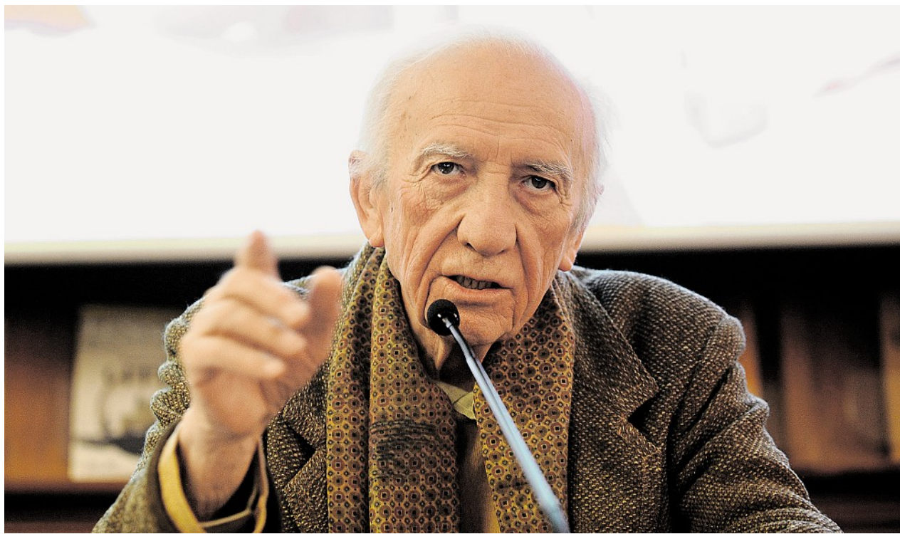
GIANCARLO MAJORINO Il poeta sarà ospite della 16. edizione di Poestate a Lugano sabato 2 giugno.